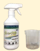
ウィツキル専用スプレーボトル 計量カップセット